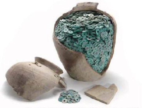
下坂本清合遺跡出土埋蔵銭(鳥取県埋蔵文化財センター所蔵)