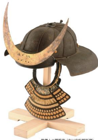
鉄騎十二間筋兜(吉川史料館所蔵)