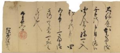
豊田秀吉朱印状(鳥取加須屋家文書/個人蔵)